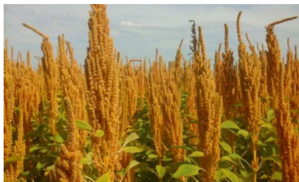
Агрокультура - амарант.

различного уровня. А в последние годы урожай масличных пополнился необычным для Сибири и полезным амарантом. Считается, что его масло замедляет процессы старения организма, по сути продлевая жизнь. Кто знает, сколько удивительных перемен переживёт сельское хозяйство к следующей сельхозпереписи, но хочется думать, что и тогда нашим аграриям будет чем удивить не только область, но и страну. А может весь мир?