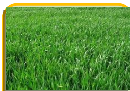
Кормовые и зерновые – 2391 га