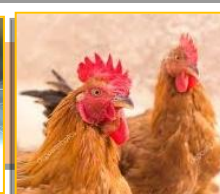
Птица 19231 голова

Говоря об инфраструктуре сельхозпроизводителей района, стоит отметить, что здесь совершенно особенная транспортная ситуация. Именно усть-ишимские переписчики, чтобы добраться «до работы» – к месту опроса, использовали водные виды транспорта: в некоторые деревни можно было