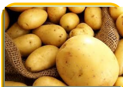
Картофель - 331 га