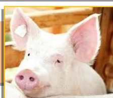
Свиньи 606 голов