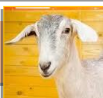
Овцы и козы 2699 голов