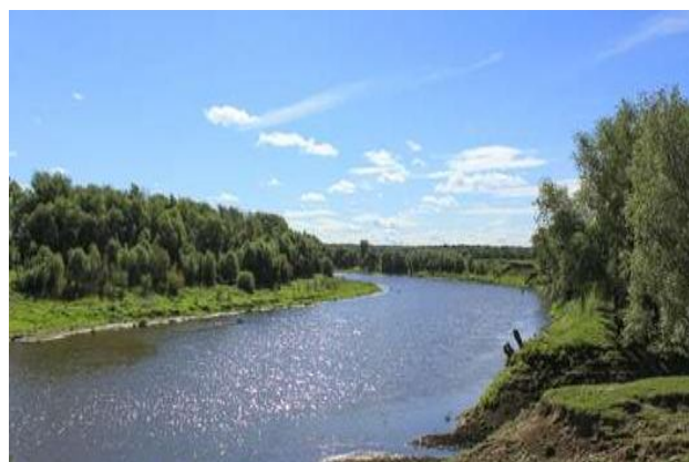
Усть-Ишимский район

При всех сложностях сельской жизни прижившиеся в Усть-Ишимском районе сибиряки не желают менять красоту первозданной природы на городские условия. Будто в подтверждение первозданности среди тайги сохранился уникальный природный памятник – реликтовая роща липы сердцевидной «Бакшеевские липняки». Широколиственные леса в Сибири сегодня – редкость, и те в основном посажены человеком. Глядя на местную благодать, словно ощущаешь незримый призыв к истокам человечества – земледелию и скотоводству. Думается, что развивая их, жизнь края, плодородного и цветущего, заиграет новыми яркими красками. И Всероссийская сельскохозяйственная перепись в очередной раз «оцифрует» успехи земляков и поделится ими с миром.