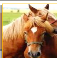
Лошади 609 голов