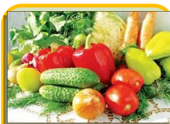
Овощи – 31 га

Средний 1) посевной участок усть-ишимского жителя, как гласит перепись, занимал 12 сот с половиной соток, из него 8 соток – картофельные «плантации», одна сотка – овощные грядки. Более четверти своих посевов местные жители