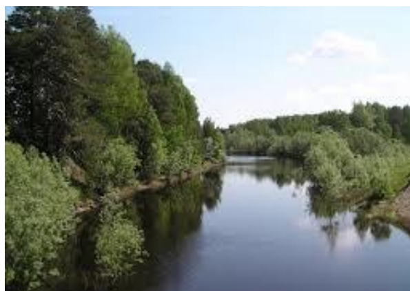
Природа Тевризского района

Первое, что приходит на ум при упоминании севера, где расположен Тевризский район, это – суровая погода: холодная зима, непродолжительное лето, короткие весна и осень, резкие колебания температуры. А вместе с тем - живописнейшие ландшафты: тайга, леса, множество рек, озер и других водных «хранилищ», невероятные природные просторы... Возможно, кто-то подумает, что сельский труд среди таёжных болот – экзотика, но местные-то знают, что это и есть настоящая жизнь провинциальной глубинки, судьба тысяч земляков с закалённым сибирским характером. И судьба эта, и аграрные успехи сегодня достойно вписываются в статистическую историю родного края через данные Всероссийской сельскохозяйственной переписи, обретая цифровое выражение в ее итогах.