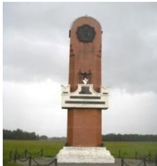
Стела на Чекрушанской пашне

...Тарский район привлекает завораживающей красотой природы – настоящая тайга, звенящий тишиной воздух и запах кедровых шишек. Леса, болота и реки – богатство района и рай для охотников, рыболовов. Интересно, что именно здесь, в селе Чекрушево, находится первое русское пашенное поле на территории Омского Прииртышья, которое появилось ещё в 1599 году. Эти места имеют потенциал и для развития животноводства – равнинный рельеф, наличие пастбищ и кормовой базы. А ещё – обилие грибов и ягод, которые не только обогащают рацион местных жителей, но и становятся их промыслом. На Тарской земле умеют распоряжаться имеющимися условиями и ресурсами, и итоги Всероссийской сельскохозяйственной переписи 2016 года – яркое тому подтверждение.