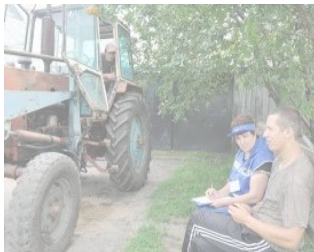
Переписчик опрашивает жителя Саргатского района

Последний факт говорит еще и о том, что с благодарностью принимая помощь властей или стороннюю поддержку, сильные духом сельхозпроизводители рассчитывают только на себя. Понимая сложность их работы, непростые условия труда, а порой даже экстремальные, диву даешься – откуда селяне черпают силы, чтобы «поднять» аграрный бизнес? Кто они - герои? Как