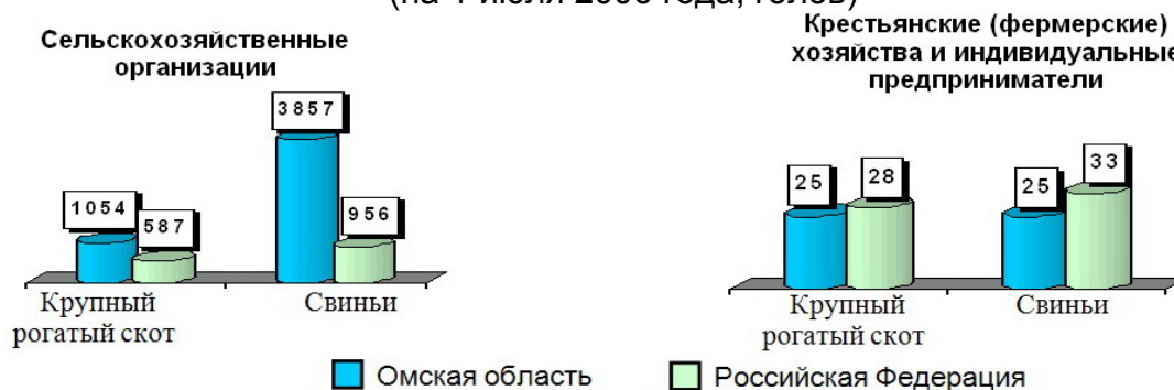
Поголовье крупного рогатого скота и свиней в среднем на одно хозяйство, имевшее поголовье соответствующего вида скота (на 1 июля 2006 года; голов)

Среди личных подсобных хозяйств граждан разведением крупного рогатого скота занимались 36,5 процента хозяйств, свиней – 32,5 процента, овец и коз – 10,8 процента, птицы – 52,1 процента хозяйств. Основная часть личных подсобных хозяйств имели до 3 голов крупного рогатого скота (74,4 % от числа хозяйств, занимающихся разведением соответствующего вида скота), до 5 голов свиней, овец и коз (84,6 % и 54,0 %), свыше 10 голов птицы (76,1 %).