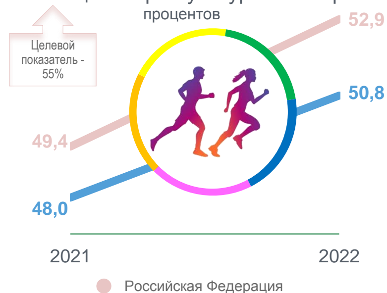
Доля граждан, систематически занимающихся физкультурой и спортом процентов