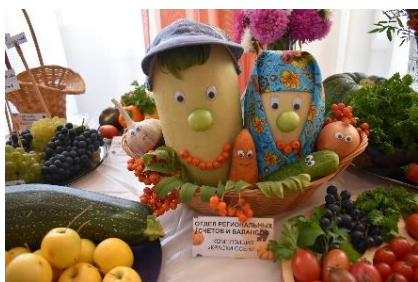
Выставка «Дары осени»

В сентябре Молодёжный совет устроил праздник осени , который всем запомнится наверняка и надолго. Открытие праздничной недели сопровождалось выставкой овощей «Дары осени» и награждением победителей фотоконкурса «Цветочная феерия». Продолжилась неделя дегустацией шарлоток, осенних пирогов и домашних заготовок. По итогам мероприятий была сделана книга рецептов.