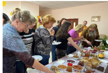
Дегустация домашних заготовок