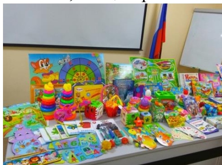
Благотворительная помощь детям

Коллектив Омкстата не остается равнодушным к проблемам других людей. Так, в течение года Молодежным советом Омкстата были проведены благотворительные акции . В рамках акции «Вагончик доброты», приуроченной ко Дню знаний, собраны развивающие игры и пособия для детей с ограниченными возможностями, которые проходят адаптацию и коррекционно-развивающие занятия с педагогами «Центра психолого-медико-социального сопровождения». Осенью прошла акция помощи защитникам ЛДНР и мобилизованным ребятам, для них собраны и переданы через Народный фронт теплые вещи и медикаменты. Сотрудники приняли активное участие в традиционной новогодней акции для воспитанников Кировского детского дома-интерната и одиноких пожилых людей, собрав предметы личной гигиены, канцелярию и мягкие сладости.