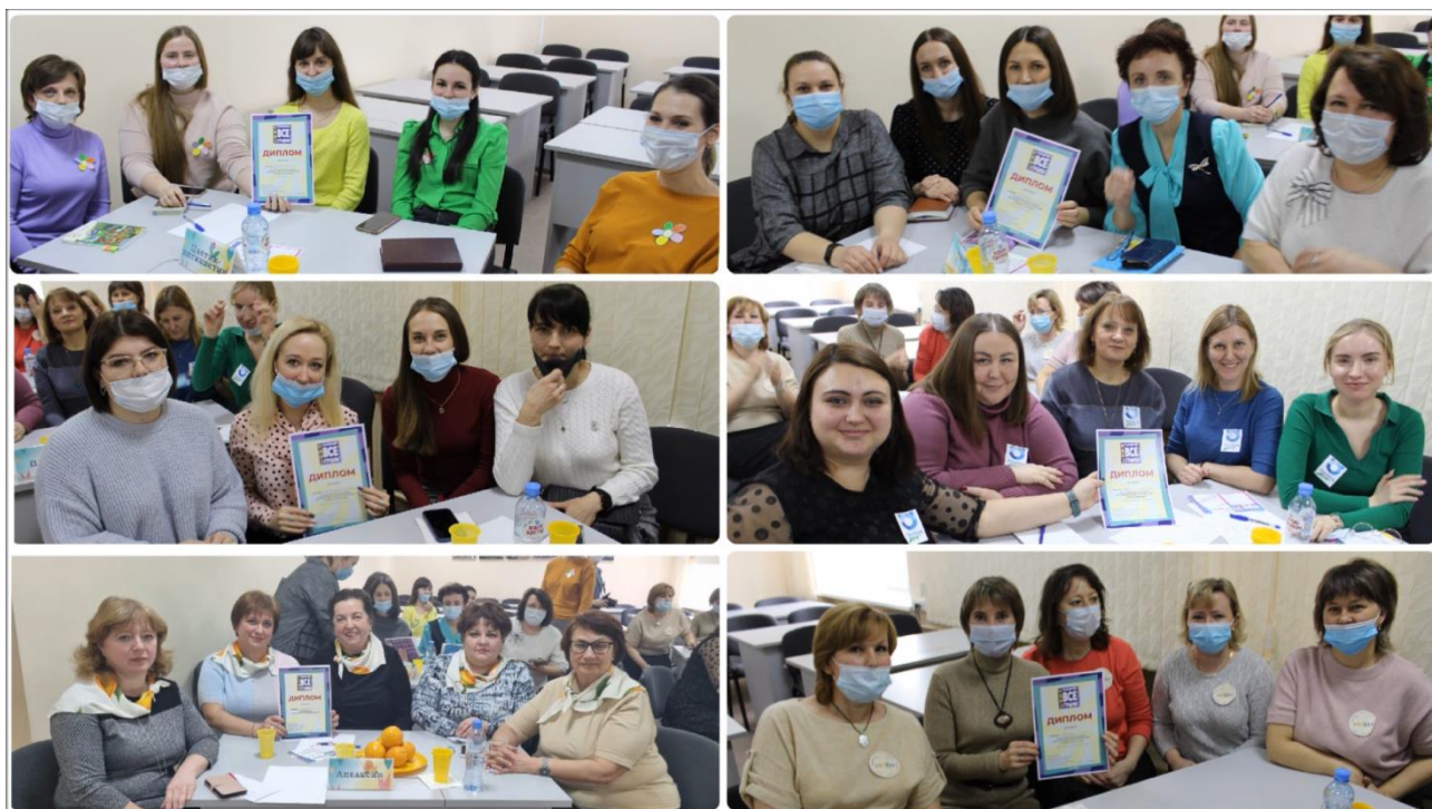
Участники интеллектуально-познавательного квиза «Раскрой все грани статистики»

В начале года Молодёжный совет провёл первый в своей истории квиз – интеллектуально-познавательную игру под девизом «Раскрой все грани статистики». В квизе участвовали 5 команд от Омскстата и 1 команда от регионального Министерства экономики. Состязания состояли из семи туров: тест-вопрос, музыкальный, логический, блиц, вопрос-картина, головоломки от ВИПИна и вопрос-аукцион. Победителем стала команда отдела статистики населения, здравоохранения, уровня жизни и обследований домашних хозяйств «Апельсин». Остальные команды получили почётные титулы «Нереальных стратегов», «Королей статистики» и «Зато красивых».