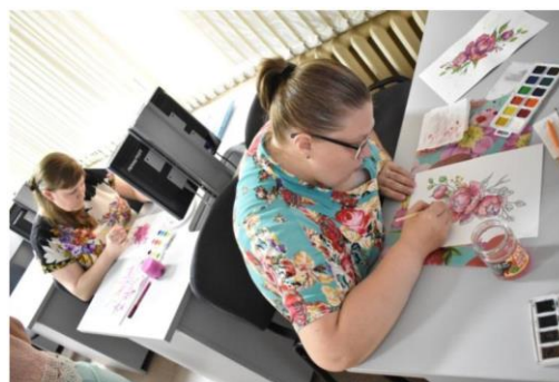
Мастер-класс «Акварельный пион»

Занятия живописью, особенно под лёгкую приятную музыку, расслабляют, оживляют фантазию, дарят вдохновение и отдых перед дальнейшим упорным статистическим трудом.