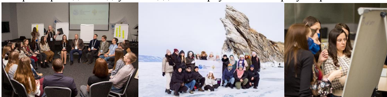
Слет молодежных советов Росстата на Байкале

Председатели молодежных объединений Урала, Сибири, Дальнего Востока и центрального аппарата встретились на Слете молодежных советов, который проходил на двух площадках: в Иркутске и на берегу озера Байкал.