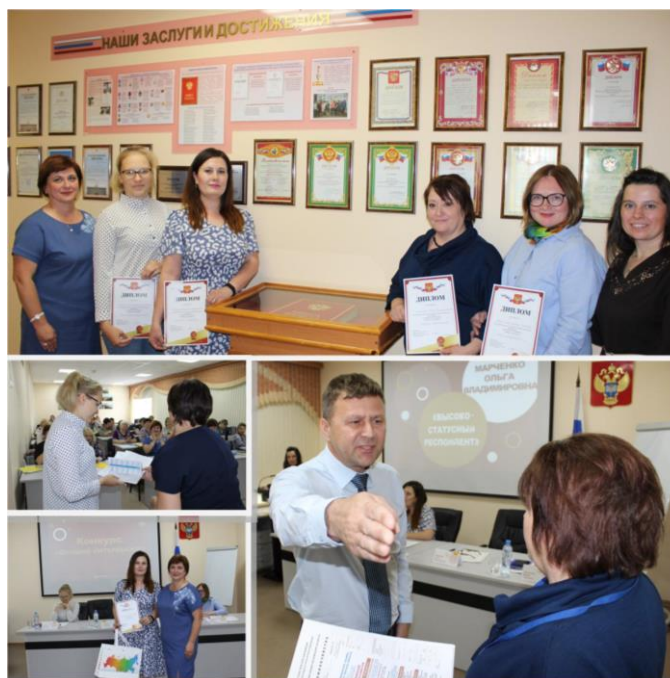
Конкурс профессионального мастерства «Лучший интервьюер»

Ценность конкурса профмастерства не только в получении призов, проверке знаний и умений. Такие мероприятия формируют команду, способствуют обмену опытом и качественному росту специалистов.