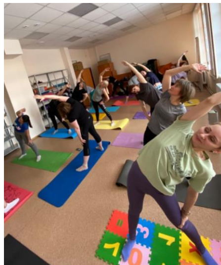
Занятие по гимнастической растяжке

Для всех желающих Молодежный совет организовал в стенах Омкстата занятия по гимнастической растяжке с профессиональным тренером. Такие занятия делают связки и суставы более эластичными, позволяя человеку выполнять движения по полной амплитуде. Растяжка стимулирует кровообращение и снимает психоэмоциональное напряжение. Еще древнегреческий философ Аристотель сказал: «Движение – это жизнь, а жизнь – это движение!». А при нашей работе растяжка точно не помешает!