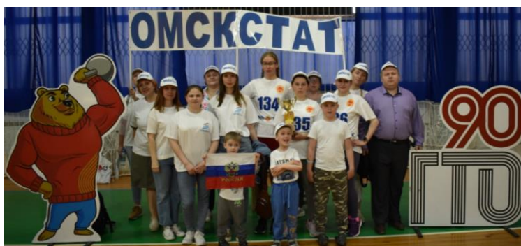
Фестиваль «Весна с ГТО»

В этом году команда Омкстата впервые участвовала в сдаче нормативов ГТО . Участникам предстояла побороться за личное и командное первенство в многоборье. Команда Омкстата получила диплом и памятный кубок за лучшую спортивную экипировку. Спортивная активность молодёжи – залог здоровья коллектива!