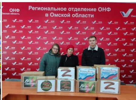
Сбор для бойцов ЛДНР и мобилизованных