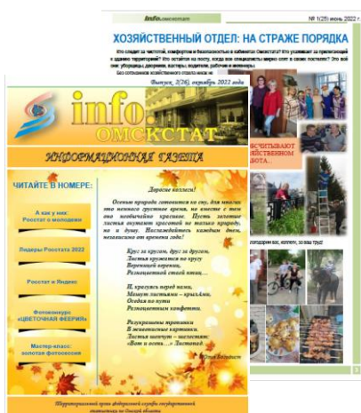
Статьи из газеты «Info.Омскстат» за июнь, октябрь 2022 года

Новые выпуски газеты «Info.Омскстат» стали заметными событиями для омских статистиков. Ведь каждый номер – это квинтэссенция впечатлений и воспоминаний о самых ярких, позитивных и значимых событиях корпоративной жизни.