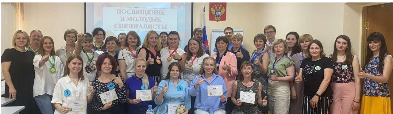
Посвящение в молодые специалисты

В интеллектуальной игре приняли участие команды молодых специалистов и опытных статистиков. КВИЗ состоял из пяти туров по 7 вопросов. В каждом туре команды отвечали на вопросы или выполняли задания в условиях ограниченного времени. Все вопросы были связаны со статистикой, экономикой, развитием цифровых навыков и знаний. Победители получили медали, а молодые специалисты – путёвку в статистику и уникальный опыт неформального общения со старшими коллегами.