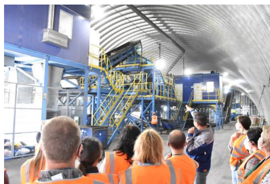
Экскурсия на мусоросортировочного завода

В сентябре коллектив Омскстата посетил мусоросортировочный завод омского регионального оператора по сбору и утилизации твердых бытовых отходов ООО «Магнит». Генеральный директор предприятия лично провёл экскурсию и продемонстрировал полный технологический цикл сортировки неорганических отходов: от машин со смешанным содержимым мусорных контейнеров на входе до брикетов с фракционным вторсырьём (картон, канистры, алюминиевая банка, полиэтилен, ПЭТ-бутылка и т.д.) на выходе. Поездка на завод вызвала живейший интерес, хоть и прошла в довольно экстремальных для офисного работника условиях.