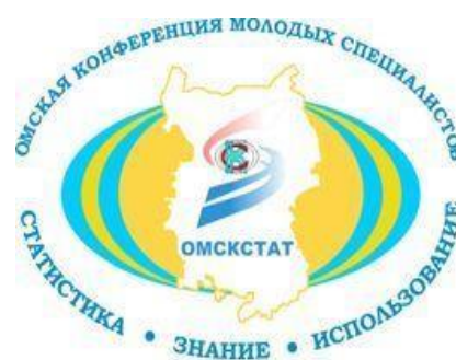
Бренд Омской конференции молодых специалистов

Основной идеей конференции осталась, как и в прошлом году, практика и минимум теории.