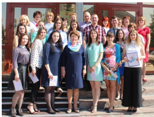
Молодые специалисты со своими наставниками на посвящении

В 2018 году Совет молодых специалистов провел, ставшую уже традиционной, церемонию посвящения в молодые статистики. В этом событии приняли участие 10 молодых специалистов, пришедших в Омскстат.