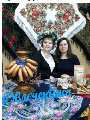
Участники акции «Библионочь 2018»

Город Омск ежегодно принимает участие во множестве социокультурных акций, которые очень понравились горожанам и нашему коллективу. Так, в целях интеллектуального и художественного развития сотрудников Омскстата Советом было организовано посещение таких мероприятий как: Ночь в музее, Библионочь и Ночь искусств.