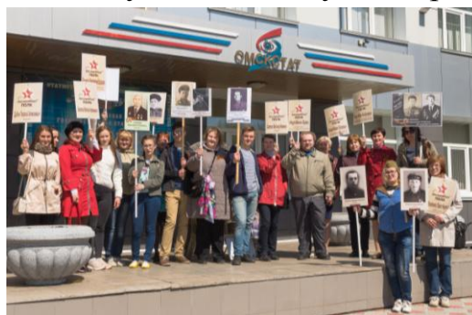
Коллектив Омкстата перед началом шествия «Бессмертного полка»

Для коллектива Омкстата стало доброй традицией принимать участие в шествии «Бессмертного полка». В 2018 году это было в четвертый раз. Вместе с фотографиями родных носим также транспаранты с именами Омских статистиков, участвовавших в Великой отечественной войне.