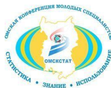
Бренд Омской конференции молодых специалистов.

По окончании каждого доклада проходила оживленная дискуссия, задавались интересующие вопросы. Кроме того, получило дальнейшее развитие взаимодействие Совета с молодыми специалистами государственных учреждений Омской области и коллегами из территориальных органов Росстата.