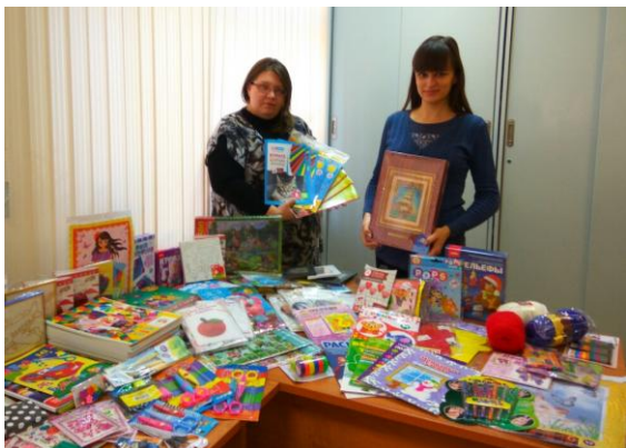
Благотворительная помощь детям

Коллектив Омскстата не остается равнодушным к проблемам других людей. Так, в предверии Нового 2019 года, при поддержке Благотворительного фонда «Надежда по всему миру», мы стали добрыми Дедами Морозами и Снегурочками, собрав внушительное количество детских принадлежностей для творчества и рукоделия для детей-инвалидов Кировского дома-интерната.