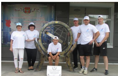
Команда бегунов Омкстата

Спортивные мероприятия, проходящие в Омске, не оставляют равнодушными наших спортсменов-любителей.