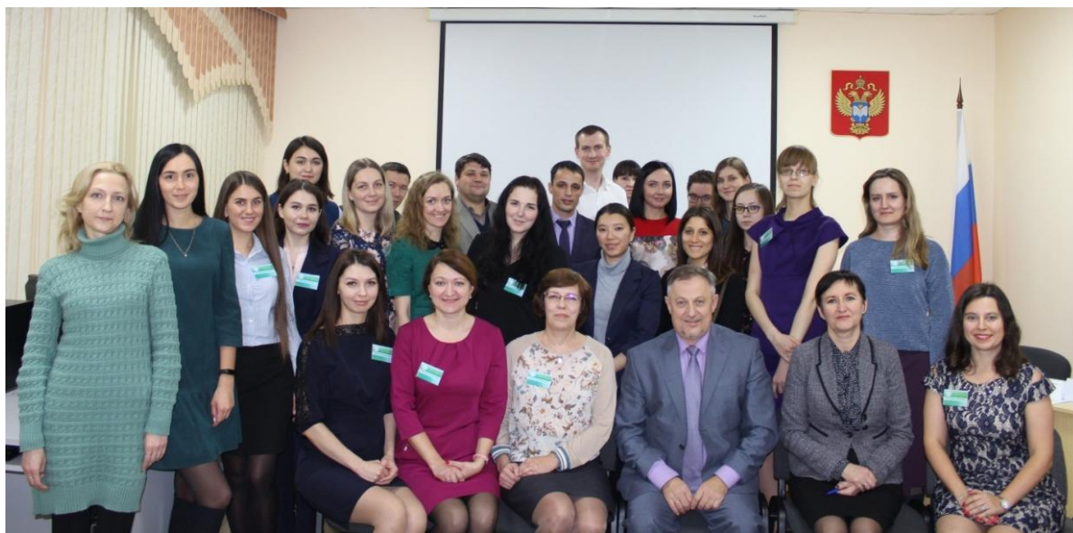
Участники конференции молодых специалистов

Для участников и гостей Конференции из Челябинскстата была организована культурно-познавательная программа: обзорная экскурсия по г. Омску, посещение Органного зала Омской филармонии и Свято-Успенского кафедрального собора. Омская конференция молодых специалистов стала одним из наиболее значимых для Омкстата событий 2018 года.