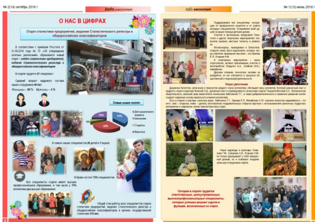
Статья из газеты «info.Омскстат» за июнь 2018 года

В течение года наши коллеги делились своими увлечениями, приятными воспоминаниями, традициями и интересными идеями подарков на Новый год. Так, мы узнали, что специалисты Омскстата открытые, целеустремленные, решительные и неординарные, любят путешествовать, посещать интересные места, заниматься вязанием, садоводством, коллекционированием и воплощать свои мечты в реальность!