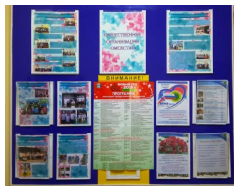
Стенд общественных организаций Омскстата

Молодые специалисты, оценивая значимость и важность реализации поставленных перед органами государственной статистики задач, наряду с выполнением профессиональных обязанностей стремятся вносить свой вклад в развитие стабильного, эффективно работающего и творческого коллектива Омскстата.