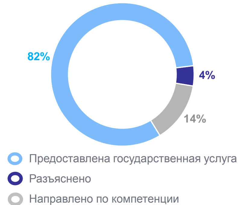
По характеру принятых решений

Основная тематика обращений (в соответствии с Типовым общероссийским тематическим классификатором обращений граждан, организаций и общественных объединений)