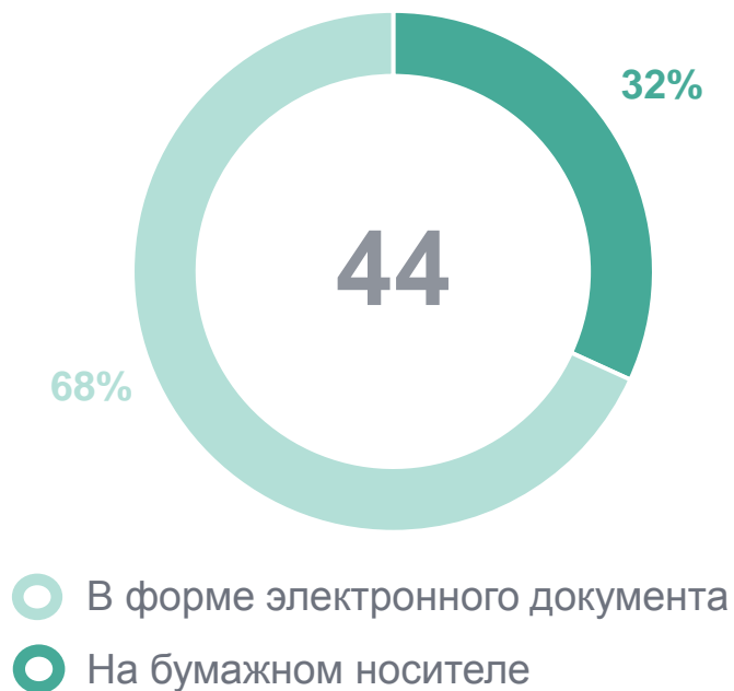
По способу направления ответа