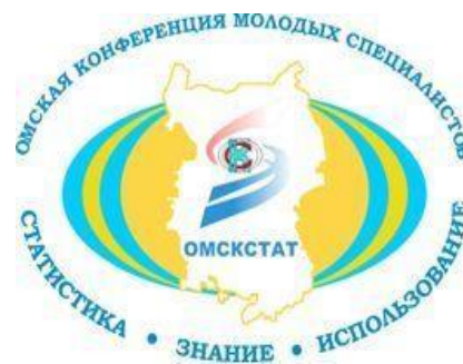
Бренд Омской конференции молодых специалистов

В течение 14 лет она служит региональной площадкой для профессионального роста молодых специалистов территориальных органов Росстата, министерств и ведомств Омской области. Участие в конференции помогает сотрудникам расширять профессиональный кругозор, развиваться, общаться и генерировать новые идеи.