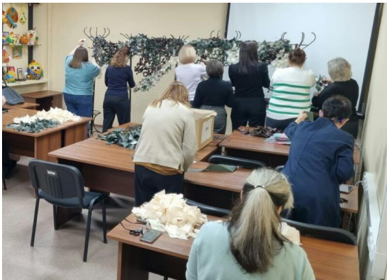
Плетение маскировочных сетей

С августа действует акция «Посылка солдату», суть которой прикладывать при отправке маскировочных сетей посылку с приятными вкусными, теплыми или душевными гостинцами.