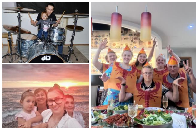
Фотоконкурс «Веселая семейка»

Для детей и внуков сотрудников Омкстата прошел конкурс рисунка на асфальте «Я люблю Россию», приуроченный ко Дню российского флага.