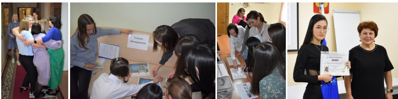
Посвящение в молодые специалисты

терминологии и «ритуальных» предметов (например, прибора для отпугивания собак, которым пользуются интервьюеры), испытать командный дух.