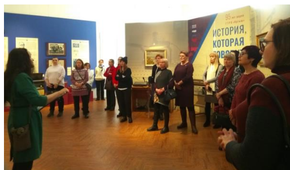
Экскурсия в Генерал-губернаторский дворец

В феврале сотрудники Омскстата посетили Генерал-губернаторский корпус Омского областного музея изобразительных искусств им. М.А. Врубеля . Участникам экскурсии рассказали об истории Генерал-губернаторского дворца, познакомили с выставкой «История, которая говорит», посвящённой 95-летию радио ГТРК «Иртыш» и с экспозицией «Роскошные четвероногие».