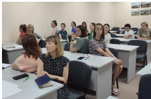
Тренинг «Эффективные коммуникации в коллективе»

Участники тренингов освоили навыки передачи информации, технику убеждения, выяснили как быть услышанным и слушать своего оппонента, как преодолевать внутренние барьеры на пути к целям, как выходить из зоны комфорта и что нас ограничивает; узнали на что влияет речь в нашей жизни, как работать с голосом и тренировать речевой аппарат, а затем смогли закрепить полученные знания на практике.