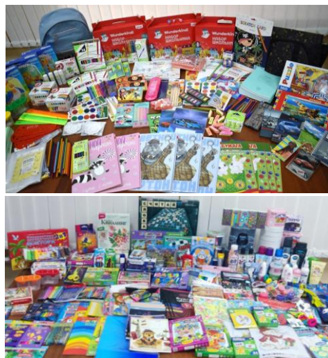
Благотворительная помощь детям

Коллектив Омкстата никогда не оставался равнодушным к проблемам других людей. Так, в течение года, Молодежный совет Омкстата активно проводил благотворительные акции . В рамках акции «Поможем детям собраться в школу», приуроченной ко Дню знаний, собрано и передано через Народный фронт более 700 различных канцелярских принадлежностей для школьников из подшефного города Стаханов в Луганской народной республике. Сотрудники приняли активное участие в традиционной новогодней акции для воспитанников Петропавловского детского дома для детей-сирот и детей, оставшихся без попечения родителей, собрав предметы личной гигиены, канцелярию и наборы для творчества.