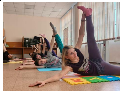
Занятие по гимнастической растяжке

В конце года команда Омкстата продемонстрировала свою спортивную подготовку и успешно сдала нормативы