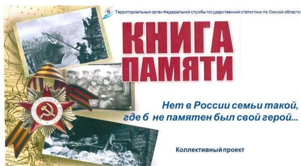
Коллективный проект «Книга памяти»

Знать наших предков – значит знать историю нашей страны и помнить о великом подвиге советского народа.