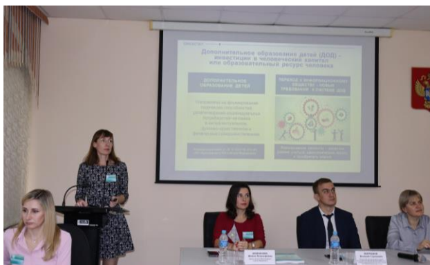
Выступление участника конференции

Основная цель конференции – рассказать о практическом внедрении и эффективном использовании новых разработок, поделиться собственными идеями и опытом.