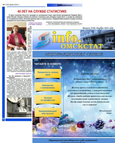
Статьи из газеты «Info.Омкстат» за июнь, декабрь 2023 года

В новой рубрике «Служу статистике» Молодежный совет представил серию интервью, посвященных деятельности наших опытных коллег. Мы узнали, как они пришли в органы статистики, что ценят в работе и чем дорожат в жизни, каких замечательных результатов мы добиваемся благодаря командному подходу.