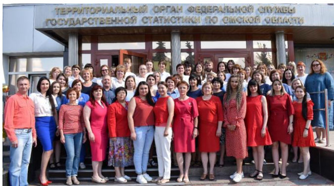
Флешмоб «Живем под флагом России»

В преддверии праздника Дня России Молодежный совет организовал ряд мероприятий: в холле Омкстата прозвучали государственный гимн Российской Федерации, поздравление руководителя и патриотические музыкальные композиции. Музей Омкстата украсили детские рисунки на тему «Моя Родина – Россия». Коллектив поддержал акцию «Живём под флагом России»: каждый сотрудник добавил в праздничный дресс-код цветовые акценты государственного флага и поучаствовал в фотофлешмобе. Фронтальные окна здания украсили изображения российского флага и символы специальной военной операции.