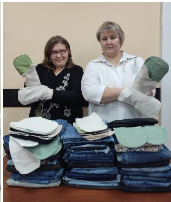
Сбор голиц и тканей для их изготовления