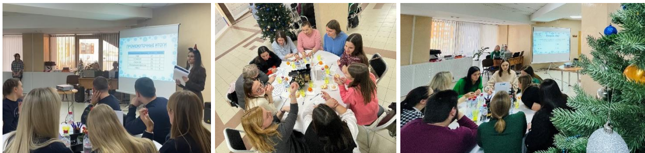
Первая межведомственная интеллектуальная игра

Всего в игре участвовало 5 команд. На протяжении шести раундов наша команда находилась в тройке призеров, но в последнем обогнала команды судебных приставов и казначейства.