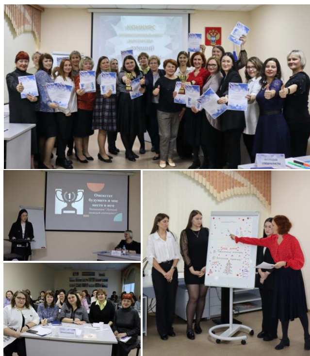
Конкурс профессионального мастерства «Лучший по профессии»

Конкурс прошел в веселом, динамичном и очень позитивном ключе, хотя немного волнительном для участников.