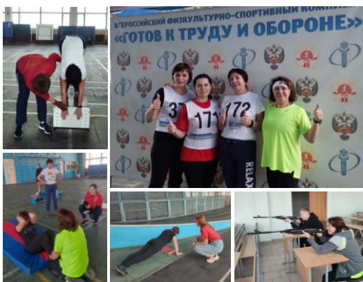
Сдача нормативов ГТО