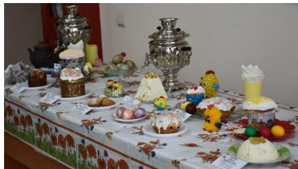
День куличей и пасх

В апреле Молодёжный совет организовал День куличей и пасх , который надолго всем запомнился. Участники дегустации совершенно не задумывались над вопросом «Как правильно: пасок, пасох или пасх?» – всем хотелось побыстрее попробовать царские пасхи, расписные яйца, аппетитные куличи.