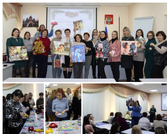
Благотворительный аукцион и лотерея «Лот добра»

В декабре в Омскстате прошли благотворительный аукцион и беспроигрышная лотерея «Лот добра» . Коллеги с азартом окунулись в драматургию аукциона, ведь больше половины представленных лотов – это предметы декоративно-прикладного творчества наших сотрудников. Все собранные средства пошли на закупку раций и пауэрбанков для подразделения, в котором служит супруг нашего специалиста.