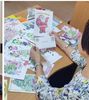
Новогодние открытки солдатам

В декабре в Омскстате прошли благотворительный аукцион и беспроигрышная лотерея «Лот добра» . Коллеги с азартом окунулись в драматургию аукциона, ведь больше половины представленных лотов – это предметы декоративно-прикладного творчества наших сотрудников. Все собранные средства пошли на закупку раций и пауэрбанков для подразделения, в котором служит супруг нашего специалиста.