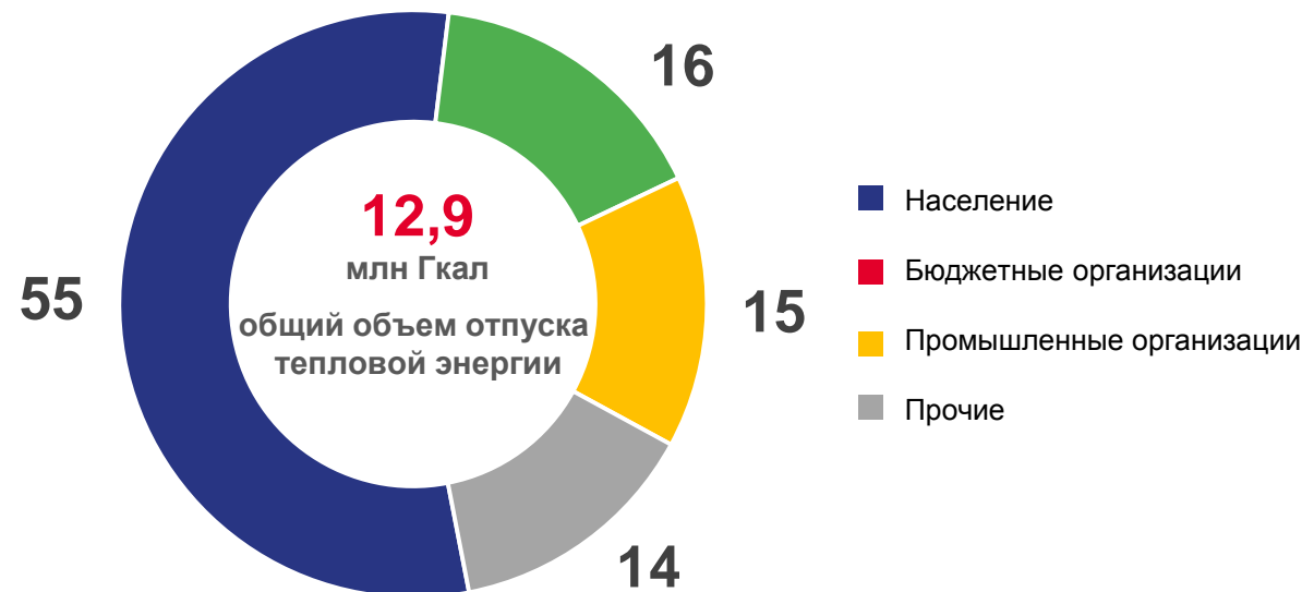
Отпуск тепловой энергии потребителям (в % к общему объему отпуска)