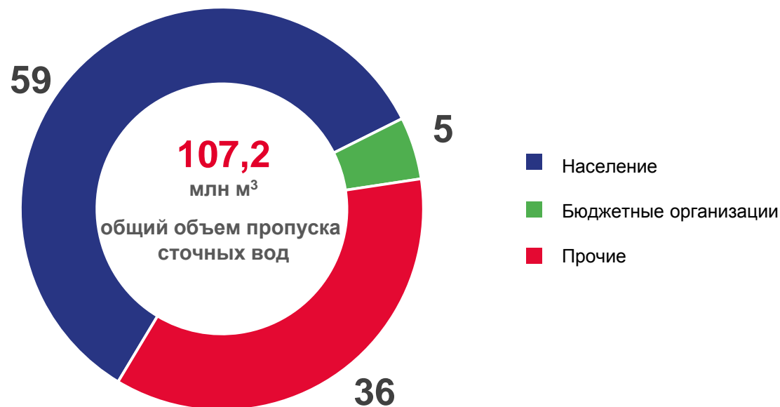
Пропуск сточных вод от потребителей (в % к общему объему)

из них 62,8% нуждались в замене 0,2% заменены