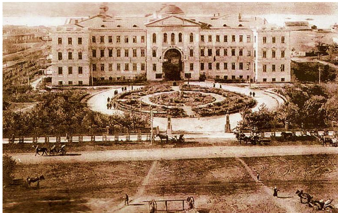
Дом судебных установлений. Вид с колокольни Успенского собора (ныне – Законодательное Собрание Омской области)

Для заведывания государственной статистикой в Сибири с согласия Центрального