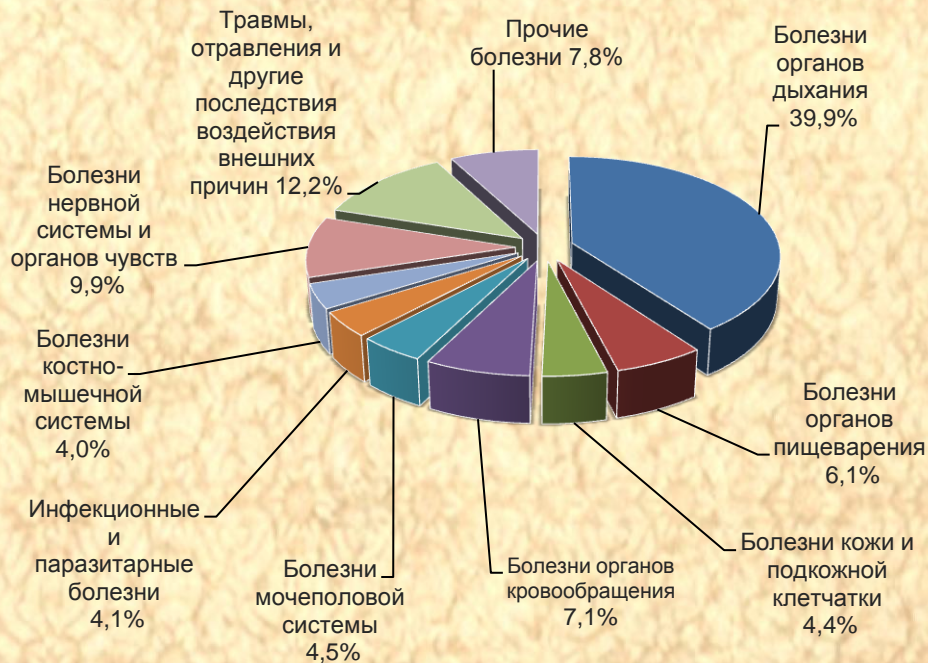
Уровень заболеваемости населения, на 100 тыс. чел.